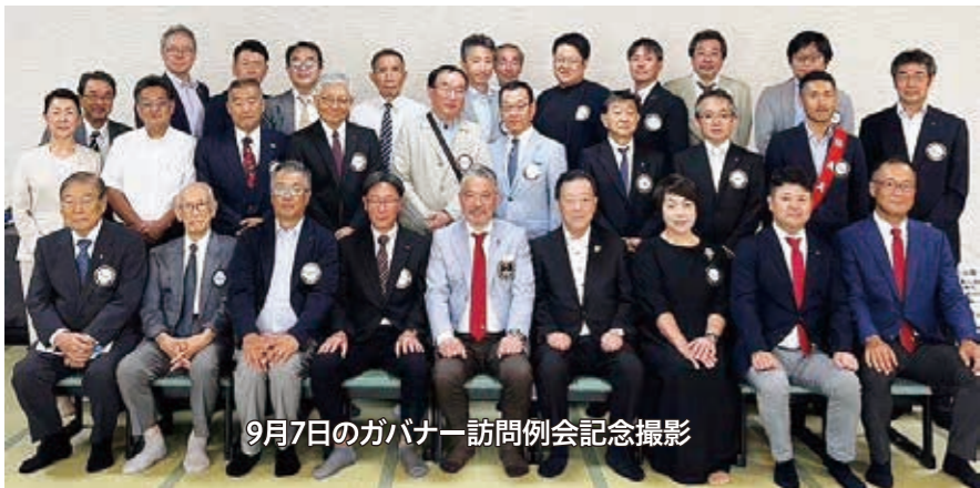
9月7日のガバナー訪問例会記念撮影